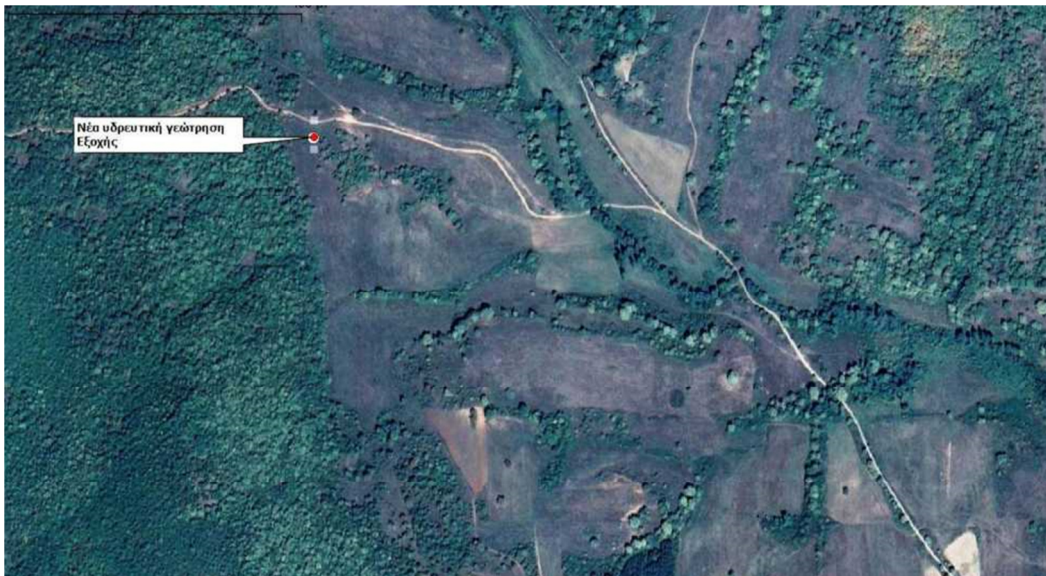
Δορυφορική άποψη της περιοχής μελέτης με την θέση της σχεδιαζόμενης δημοτικής υδρευτικής γεώτρησης εντός παραχωρηθέντος τμήματος του υπ' αριθμόν 1859 γεωτεμαχίου, αγροκτήματος Εξοχής (Σ.Δ. 1960), Δήμου Κάτω Νευροκοπίου.

Για την ανόρυξη της γεώτρησης και την άντληση του υπόγειου νερού εκδόθηκε από την αρμόδια Διεύθυνση Υδάτων στην Καβάλα της Αποκεντρωμένης Διοίκησης Μακεδονίας & Θράκης η άδεια εκτέλεσης έργου αρ πρωτ. 204423/26-08-2022